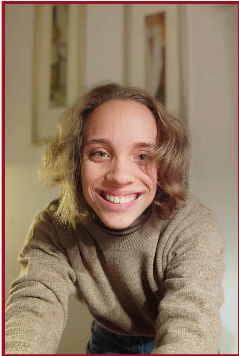
Mensch · Para-Athletin · Inklusionsaktivistin